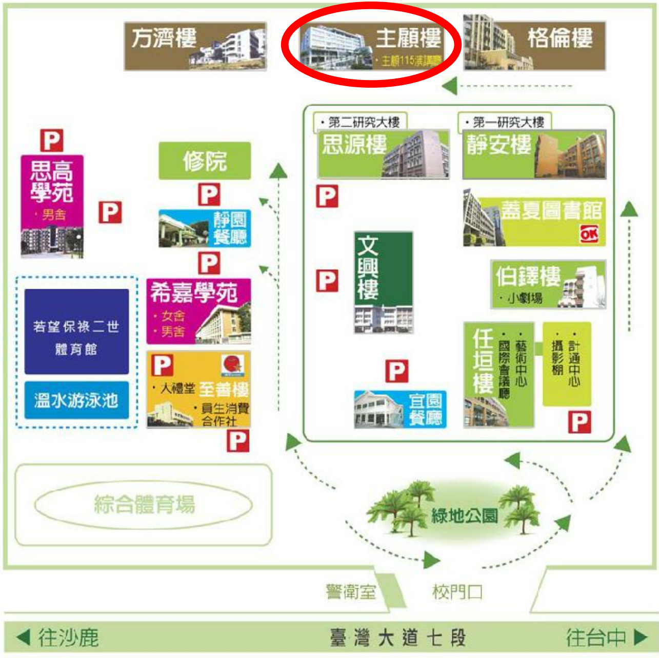
【靜宜大學校區配置圖】