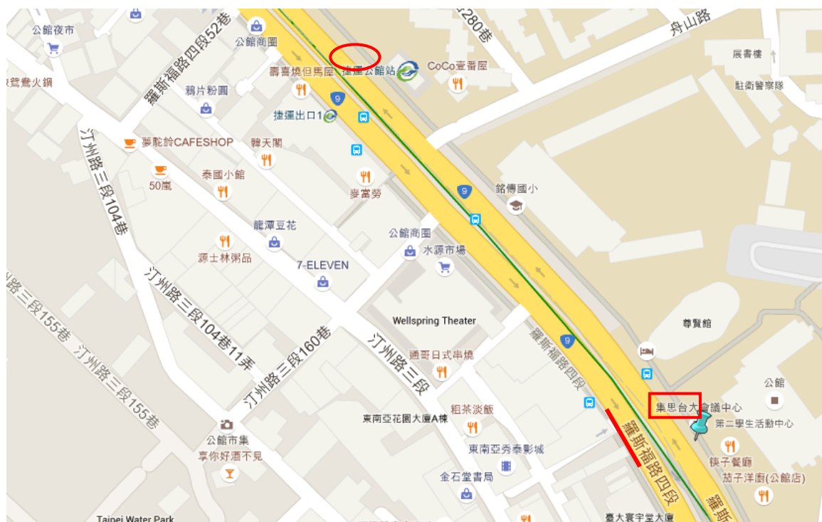
圖 3：集思台大會議中心交通位置圖