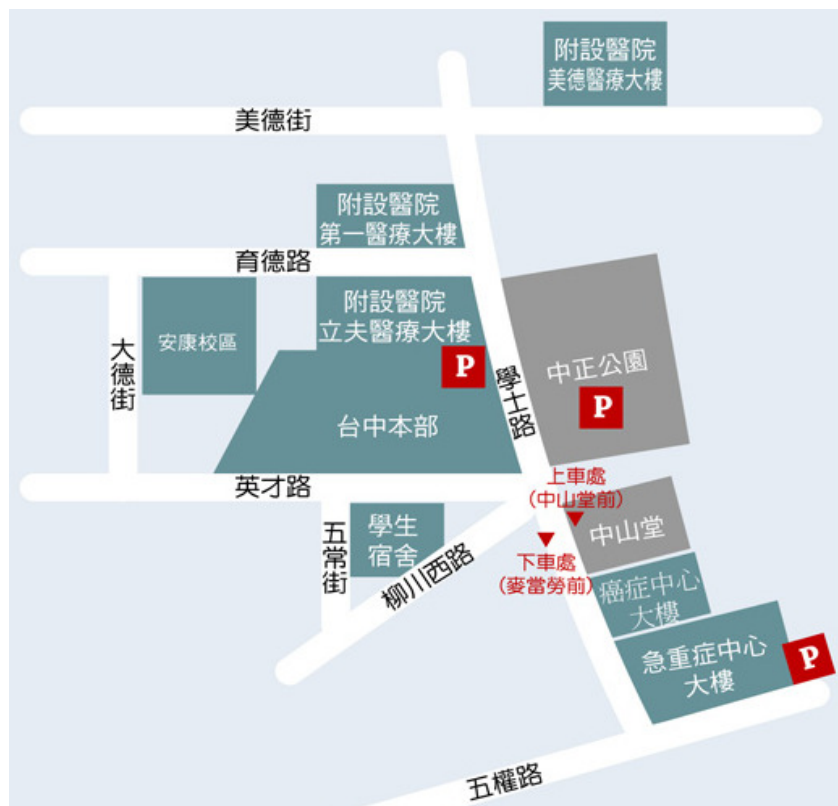
高鐵路免費快捷專車-中國醫藥大學站 接駁位置圖 (更多資料請參考： 台灣高鐵路轉乘服務資訊 )

97 年 1 月 16 日起高鐵台中站免費接駁專車延伸至本校發車（統聯客運），分別於【台中站 6 號出口 13 號月台】及【學士路「中國醫藥大學」市公車站牌（中山堂前）】上車，車程約 40 分鐘。搭車位置可參考下圖：